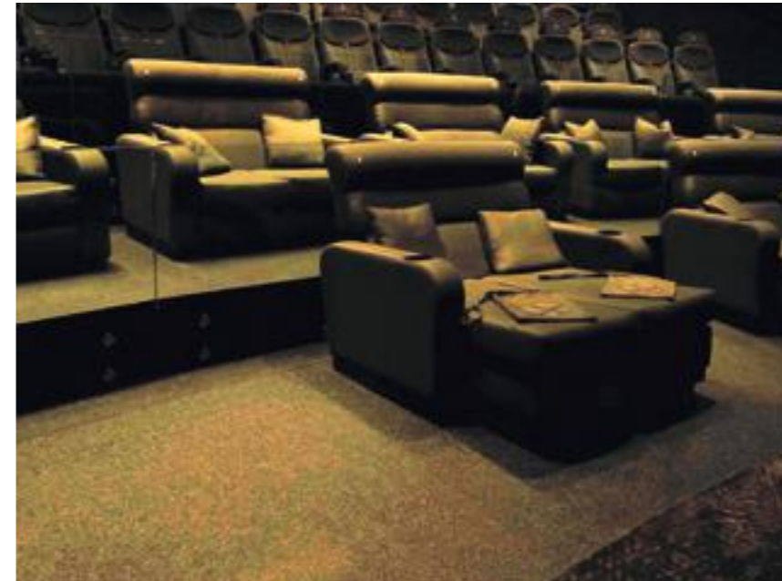
Rollstuhlplatz und gemütliches Lounge Sofa

Gleich direkt vor dem Kinoportal hat man genügend Behindertenparkplätze eingerichtet. Links neben dem Haupteingang befindet sich für Rollstuhlfahrer ein separater Eingang. Die erste Tür öffnet sich automatisch, für die zweite ins Kinofoyer ist ein