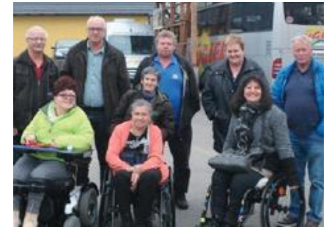
Mitglieder aus Völkermarkt und Wolfsberg erproben den neuen Kügler-Bus

Nach einer kurzen Kaffeepause nahmen sich die Teilnehmer Zeit den beiden Busfahrern zu zeigen, worauf zum sicheren Transport im Umgang mit Menschen im Rollstuhl besonders zu achten ist. Obwohl es die erste Fahrt war, hatte alles perfekt funktioniert und auch der Spaß kam nicht zu kurz. Nach der Rückkehr wurden bei