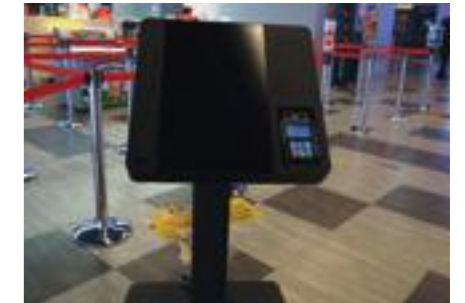
Unterfahrbarer Ticketautomat mit großen Touchscreen

neuen gemütlichen Lounge Sofas ergibt sich gerade für Begleitpersonen oder Familien ein besonderer Mehrwert. Rollstuhlfahrer zahlen übrigens einen reduzierten Eintrittspreis von EUR 6,- (regulär 9,90). Und wer vor oder nach dem Kinobesuch hungrig ist, kann sich im angeschlossenen Lokal „Clock Tower“ stärken. Es ist ebenfalls schwellenlos zugänglich und der obere Bereich sogar mit Lift. Insgesamt scheint man sich bei der barrierefreien Planung auf Rollstuhlfahrer konzentriert zu haben. Denn für blinde und sehbehinderte Menschen fehlen taktile Leitsysteme. „Wir werden den Betreibern eine Liste mit Verbesserungsvorschlägen zukommen lassen. Ich hoffe, dass sie unsere Anregungen als Aufklärung verstehen und bemüht sind diese umzusetzen“, so Kravanja nach dem Kinorundgang.