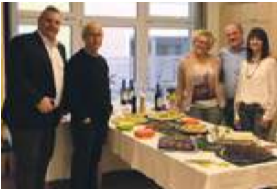
Finissage bei den 4 Jahreszeiten