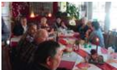
Weihnachtsfeier des ÖZIV Feldkirchen

D ie Bezirksgruppe des ÖZIV Feldkirchen veranstaltete am 10.12.2016 im Gasthaus Kreuzwirt Fam. Scheiber in St. Ulrich ihre Weihnachtsfeier. Zahlreiche Mitglieder sind der Einladung gefolgt. Lieder und Gedichte wurden vom Volksliedchor Himmelberg vorgetragen, treue Mitglieder erhielten Ehrenurkunden in Platin, Gold, Silber und Bronze. Rundherum war das Fest sehr gelungen und wir freuen uns schon auf die Veranstaltungen im Jahr 2017.