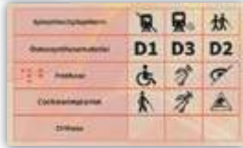
Die Rückseite des Behindertenpasses