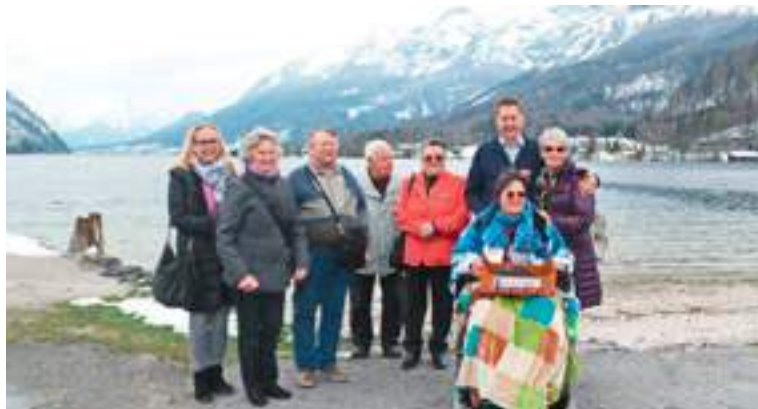
Gute Stimmung bei der Frühlingsfahrt der BG Villach