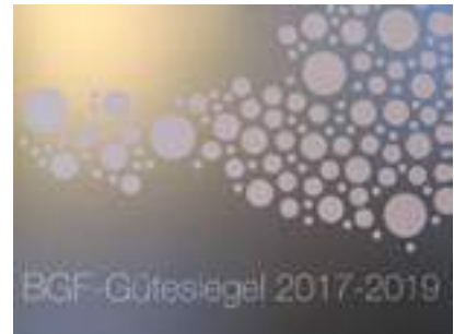
BGF-Gütesiegel für den ÖZIV Kärnten