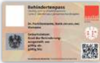
Die Vorderseite des Behindertenpasses